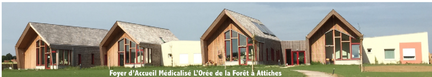
Foyer d'Accueil Médicalisé L'Orée de la Forêt à Attiches